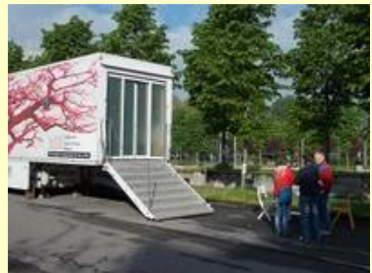
Il BOBAB a Rozzano