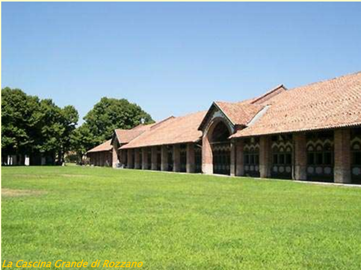
La Cascina Grande di Rozzano