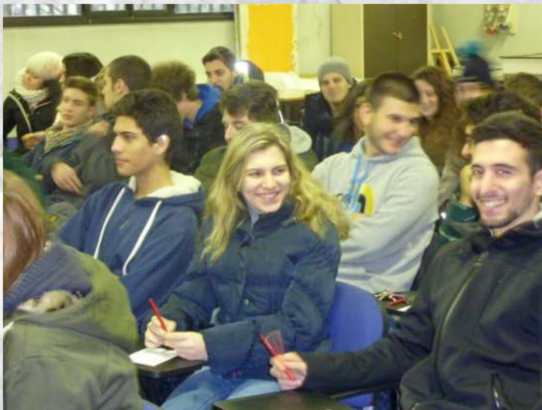
I ragazzi dell'Istituto Calvino di Noverasco durante l'incontro dello scorso gennaio

Bollettino periodico di FIDAS-MILANO Onlus