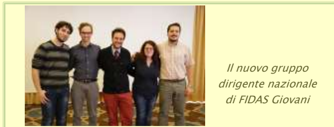
Il nuovo gruppo dirigente nazionale di FIDAS Giovani