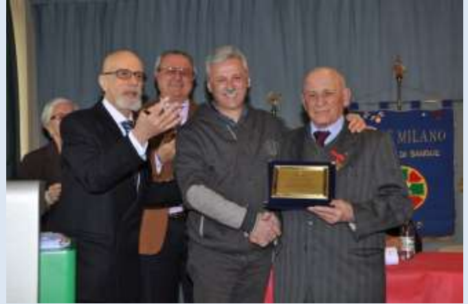
La cerimonia di premiazione nel corso dell'Assemblea Sociale 2013.

esame l'attività dell'Associazione e i risultati ottenuti nell'anno appena trascorso, si assegnano i vari riconoscimenti a quanti li hanno meritati svolgendo bene il loro compito di donatore. Vi esorto quindi ad essere presenti, almeno tutti i premiati, in grande numero, l'Associazione ne guadagnerà anche agli occhi degli ospiti in rappresentanza di altre associazioni e delle istituzioni territoriali presenti per l'occasione. Vi aspetto!