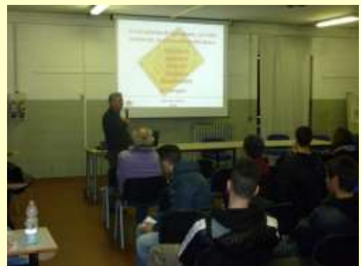
La proiezione dei nostri multimediali

E' un buon numero, ma sappiamo che passare dall'intenzione all'azione non è semplice e sicuramente non scontato. Quindi stiamo aspettando di effettuare le visite al centro Trasfusionale dell'Ospedale San Paolo per avere i numeri certi delle adesioni. Siamo fiduciosi.