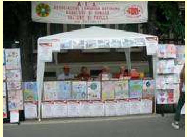
Lo stand FIDAS a un Cià che girum